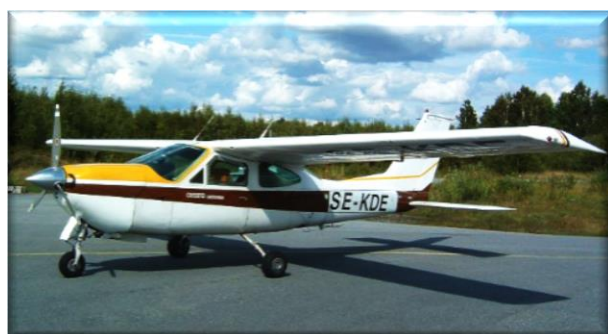
Cessna 177 används vid fotograferingen.

Vi kan hjälpa Er att markera vad vi anser är intressanta varma ytor.